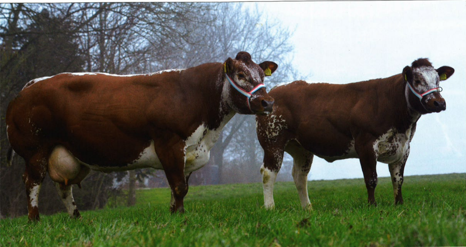
De excellente stalfavoriet Coba 16 , goed voor een melkproductie van 5600 kilo melk, met haar Jacobardochter en showwinnares Coba 19

af naar slechts supermarktvlees. Bovendien moeten vleesveehouders en slaggers de positieve kenmerken van de vleesveehouderij veel meer uitdragen. We gebruiken van alle dierhouderijen de minste antibiotica, veel dieren worden op stro gehouden in plaats van op roosters en het gros gaat naar buiten.'